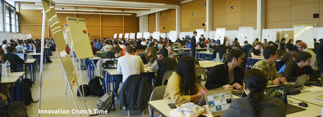
Innovation Crunch Time